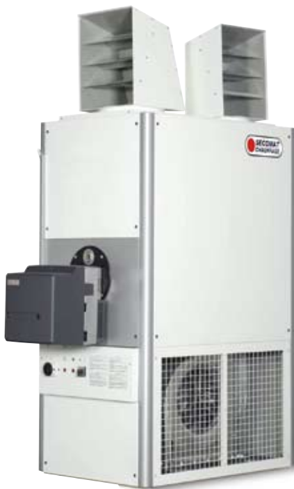
UNIT avec brûleur et option plenum avec têtes de soufflage pivotantes

UNIT with burner and optional plenum with directional outlet heads