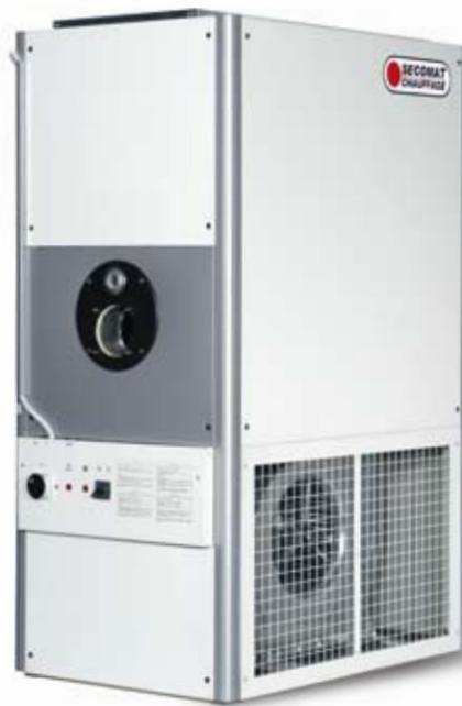
UNIT sans brûleur UNIT without burner

UNIT with burner and optional plenum with directional outlet heads